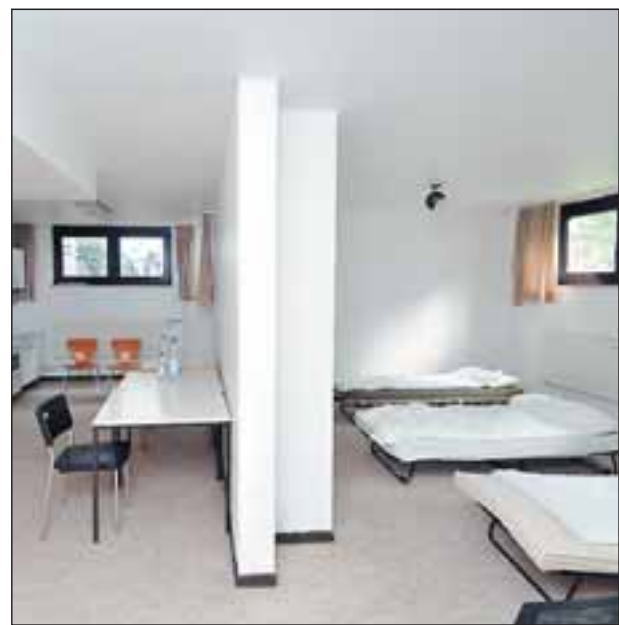
Die erste Nacht im Klappbett kostet acht, alle weiteren vier Euro: Die Notunterkünfte des Studentenwerks sind naturgemäß nicht gerade Luxusquartiere.

Heidelbergs Wohnungsmarkt kann den Erstsemester-Ansturm nicht bewältigen – Das Studentenwerk richtet Notquartiere ein